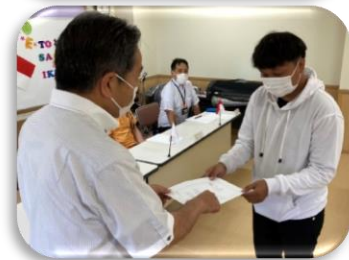
辞令交付式の様子