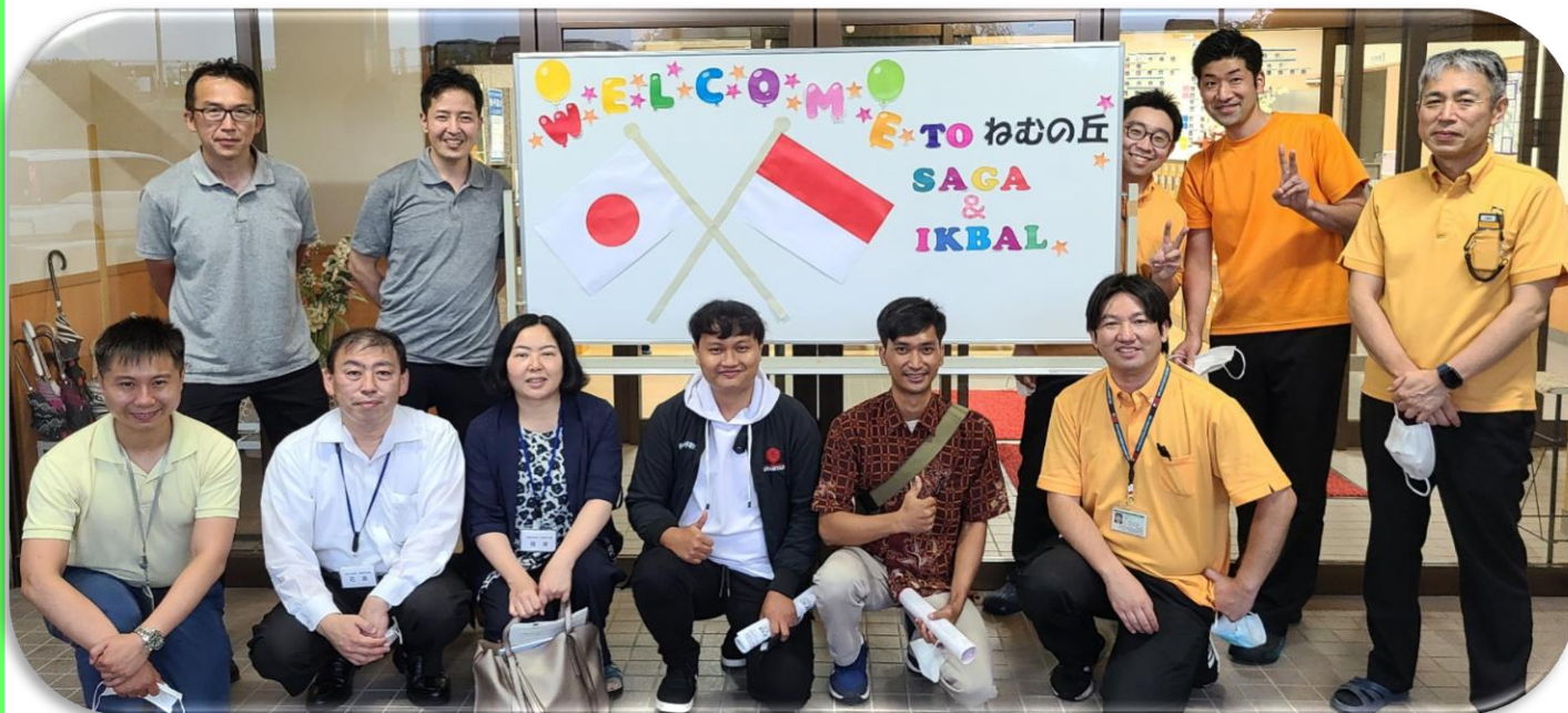
初めてねむの丘に来たので記念撮影をしました☆