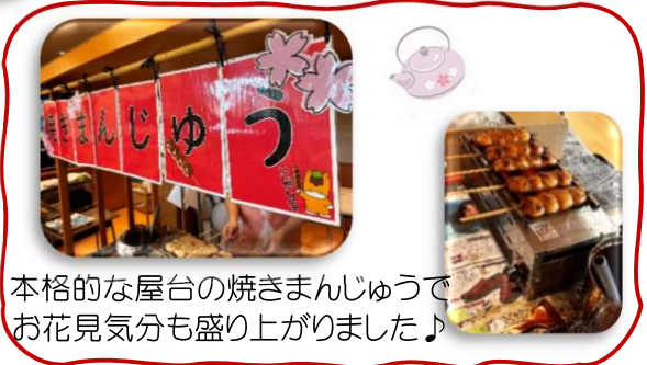
本格的な屋台の焼きまんじゅうでお花見気分も盛り上がりました♪