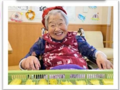
牡丹餅を作りました♪とてもおいしくできました！